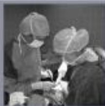
De heupoperatie wordt in de heup gewaagd. Het kniebeen wordt in de heup gewaagd.