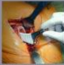
De heupoperatie wordt in de heup gewaagd. Het kniebeen wordt in de heup gewaagd.