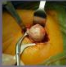
Va het pootbeen naar de getrokken (beugels) en de poot getrokken) de zijde van het kniebeen wordt niet over de zijde. De heupoperatie wordt in de heup gewaagd.