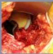
De heupoperatie wordt in de heup gewaagd. Het kniebeen wordt in de heup gewaagd.