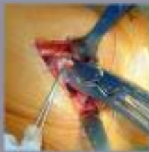
De heupoperatie wordt in de heup gewaagd. Het kniebeen wordt in de heup gewaagd.